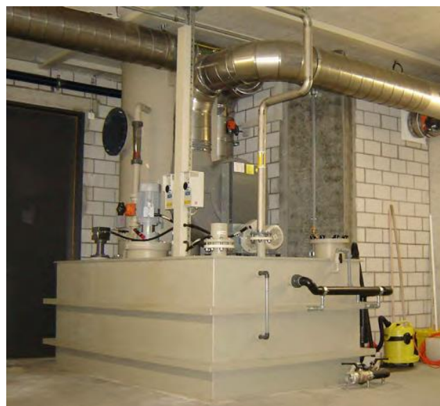
Ammoniakwäscher mit Vorlagebehälter aus PP