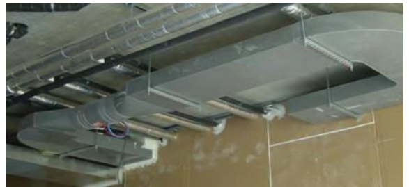
PPs Abluftanlage mit Volumenstromregler