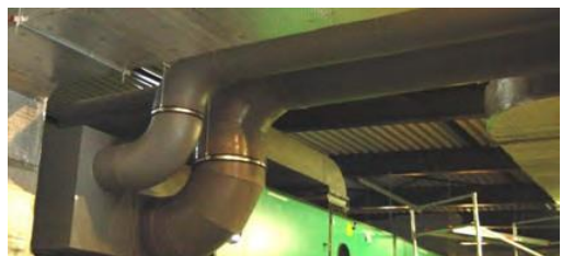
PPs Abluftleitungen Ø 400 mit Monobloc-Anschluss