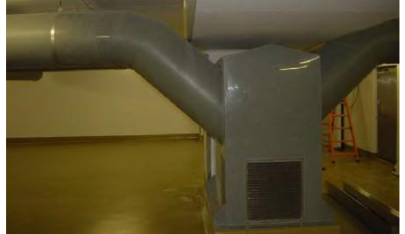
Belüftung von Käselagerkeller aus PVC