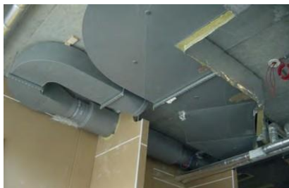
PPs Abluftanlage mit Schalldämpfer, vorbereitet um F 30 zu Isolieren