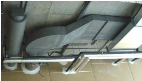
PPs Abluftanlage mit Schalldämpfer