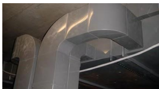
PPs Abluft Übergang der Steigzonen in Sammelkanal