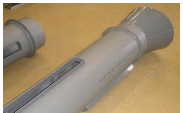
Spezielle Lüftungsübergänge aus PPs