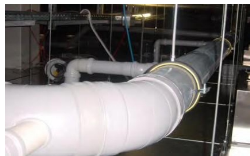
PPs Abluftsystem von Reinräumen