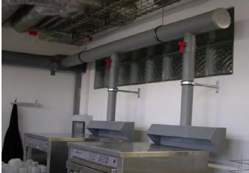
PPs Abluftsystem mit örtlicher Absaugung

Neben den Standardlösungen bietet Hürner AG aufgrund seiner jahrzehntelangen Erfahrung und dem hierbei erworbenen Know how auch individuelle Systeme, die auf spezielle Kundenbedürfnisse flexibel und lösungsorientiert eingehen. Fragen Sie uns an!