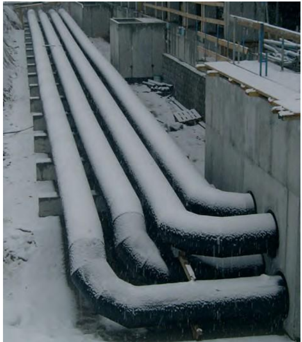
Erdregister mit einer 2. unteren Lage aus PE-HD-Rohren Ø 630mm