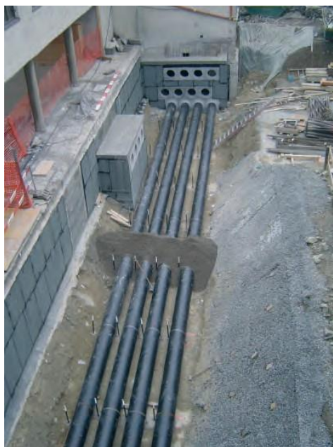
Ø 500 PE HD 1. Lage