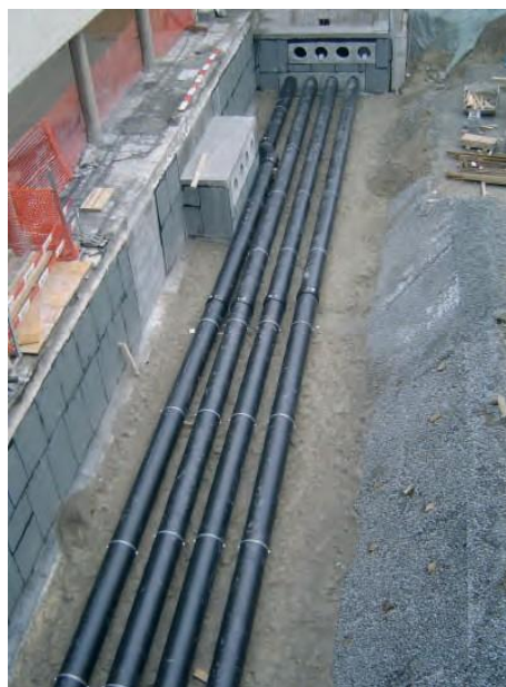
Ø 500 PE HD 2. Lage