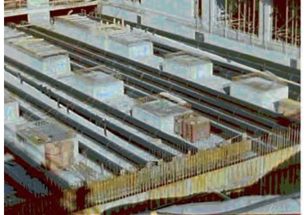
Erdregister aus einer Lage PE-HD-Rohren Ø 500mm