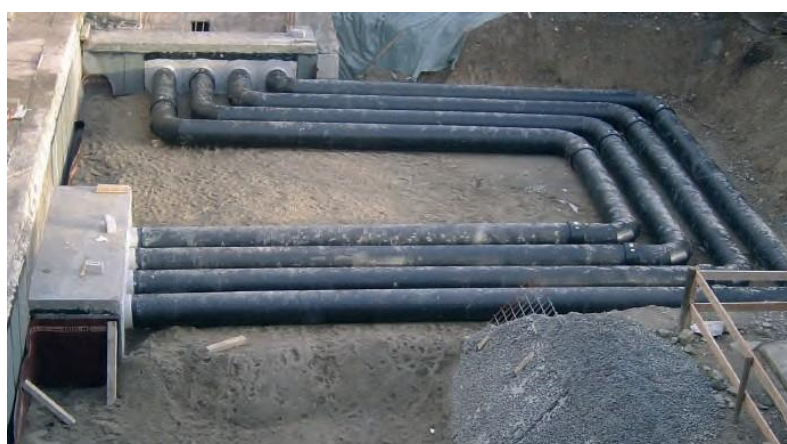
Ø 500 PE HD 3. Lage