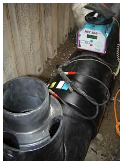
PE-Doppelrohrleitung im Grundwasserbereich für Liegenschaften-Entwässerung und evt. belastetes Oberflächenwasser von Strassenentwässerung