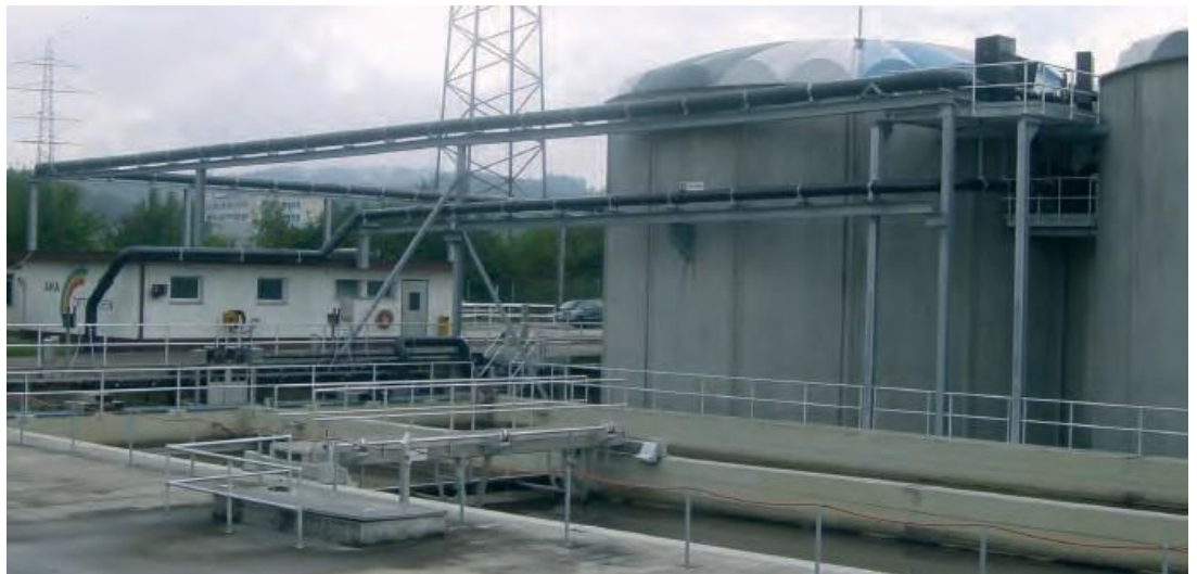
Separatableitung in Kläranlage als isolierte Doppelrohrleitung