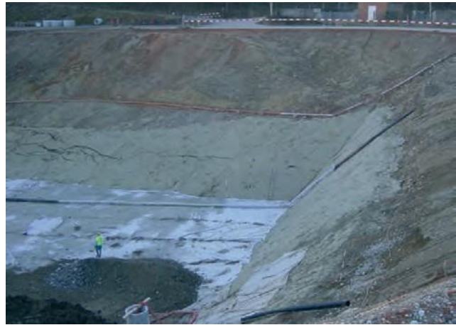
Sickerleitung unter Deponieabdichtung aus PE-HD-Rohren