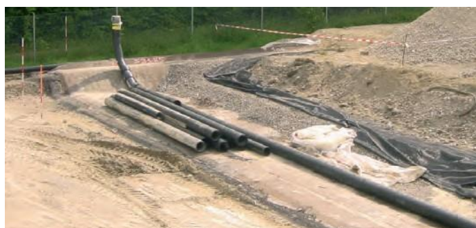
Sickerleitung mit Vorbereitung für Spülschacht