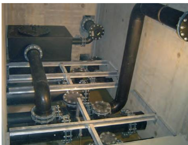
Deponieentwässerung mit Kontrollschacht und Bypass-Leitungen aus PE HD, ergänzt mit PE-EL Abluftleitung