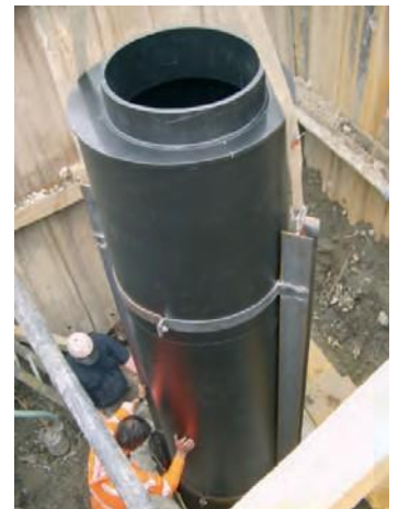
Ersatz eines 10 m tiefen Deponieschachtes