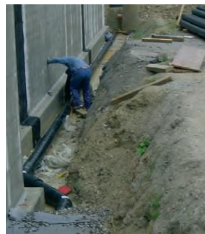
Grundwasserentwässerung von Deponieversorgungskanal